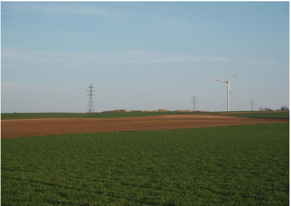
Landnutzung im Wandel