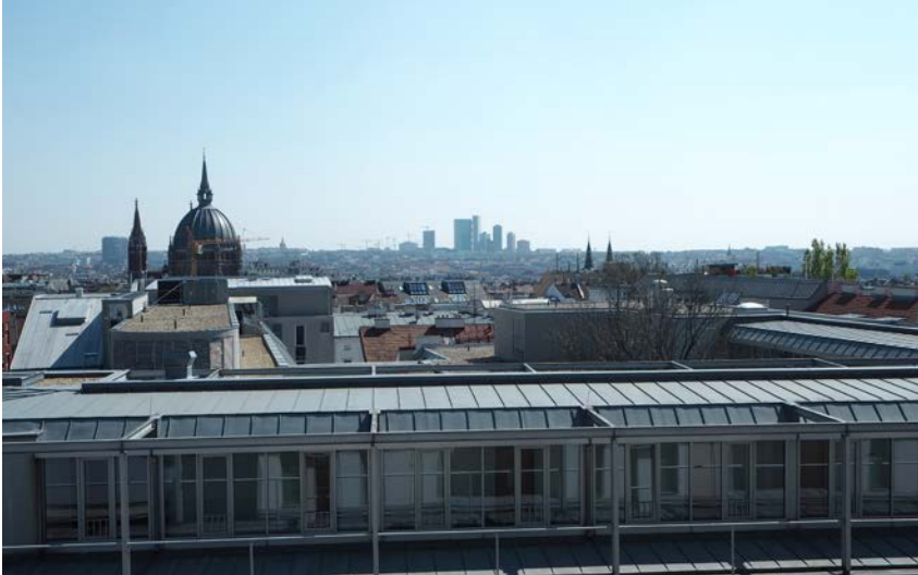
Stadt im Wandel